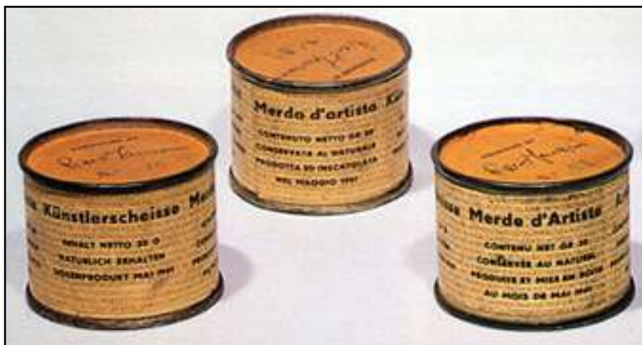
Merda de artista n.076, 008, 001, 1961 (4,8 x 6,5 cm.)