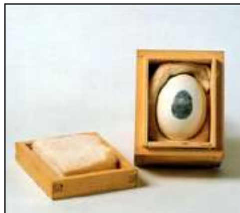
Huevo con impresión n. 14, 1960. Huevo, tinta, madera. (5,6 x 8,2 x 6,8 cm.)