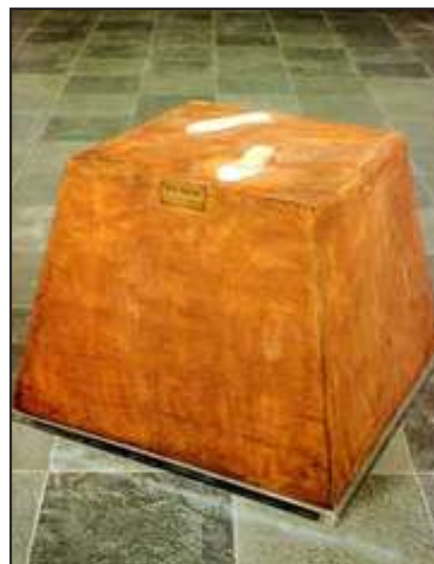
Base mágica, 1961, Madera (80 x 80 x 60 cm.)