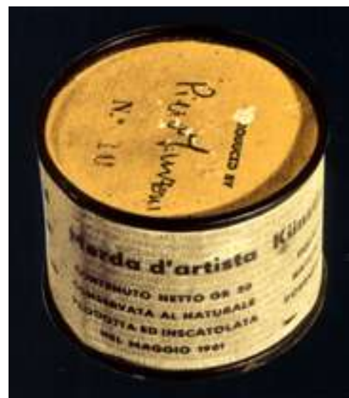
Mierda de artista n. 010, 1961. (4,8 x 6,5 cm.)