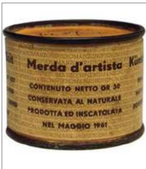
Mierda de artista n. 066, 1961. (4,8 x 6,5 cm.)